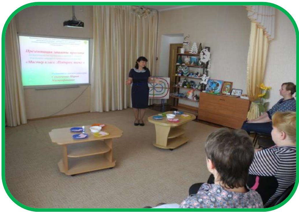
Районные методические объединения для заведующих и методистов