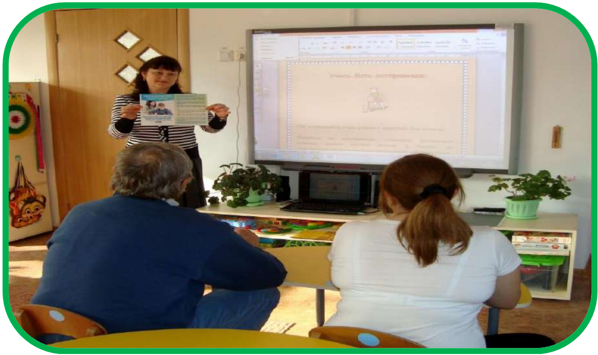
Проведение консультаций для родителей «Круглый стол»