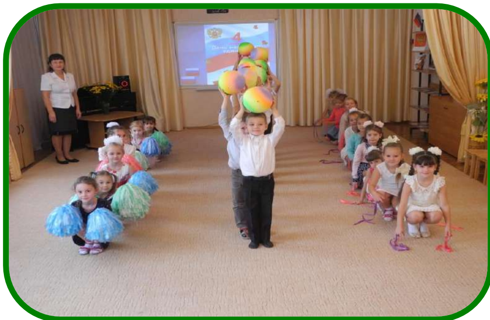
Семейный праздник «День семьи, любви и верности»