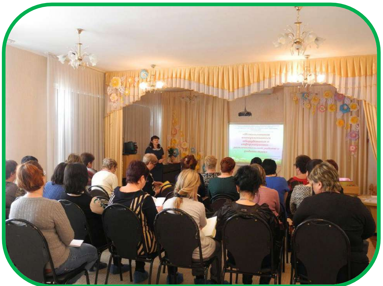
Досуги и развлечения