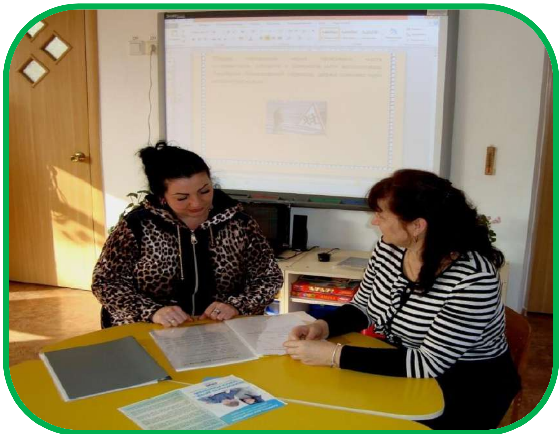
Мастер-классы для педагогов из опыта работы